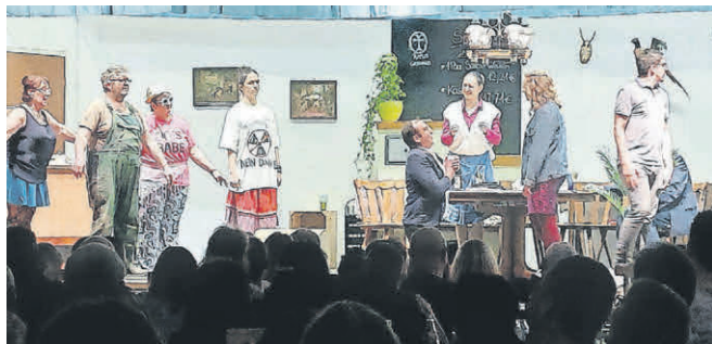
Die Theateraufführungen in Rot an der Rot und Ellwangen haben begonnen.